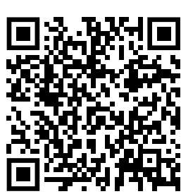
БАЗА ЗНАНЬ НАЗК