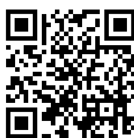
ДЕ ОТРИМАТИ КЕП